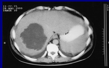
TAC: Absceso Hepático